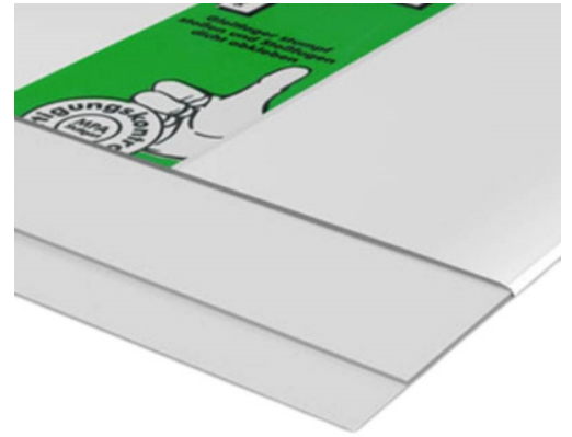
Liukulaakeri F150/1500 Suurin puristuslujuus 15N / mm 2

Liukulaakerit ovat saatavilla nauhamaisina muurattaviin leveyksiin tai räätälöityinä mittatilaustuotteina pistekuormille. Ne mahdollistavat rakenteen liikkeet muodonmuutosten aikana ja ehkäisevät halkeamien syntymistä. Saumat viimeistellään SPEBA-peitenauhalla, joka takaa siistin ja toimivan lopputuloksen.